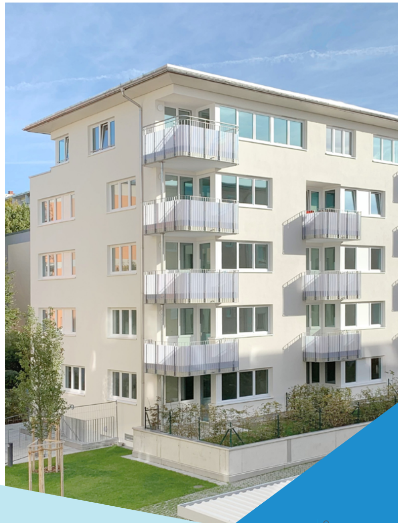
Abb: Neubau, 28 Wohnungen mit Solaranlage, Andernacher Straße 6a/b, 80993 München

Die Bayerische stellt in erster Linie gewerblichen Kunden Darlehen zur Verfügung. Wir finanzieren zu großen Teilen Einrichtungen der öffentlichen Infrastruktur und Wohnungsbauprojekte und schaffen so zusätzlichen Wohnraum in Ballungsgebieten.